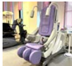
▲新型の牽引装置です

今年の8月より、リハビリ用の牽引装置を新しくしました。今回新しくした機器は背もたれがゆっくりと自動で倒れ、ゆりかごのようにやさしく牽引を受けるような心地よさがあり、適切な治療により、患者様により安心感を与えることが出来るようになりました。また、ソフトな空気力で足を包み込み、安定した牽引姿勢をサポートする機能を装備しているため、リラクゼーション効果も期待できます。実際に利用していただいた患者さんからも「以前より効果が感じられるようになった」とご好評の声をいただいています。